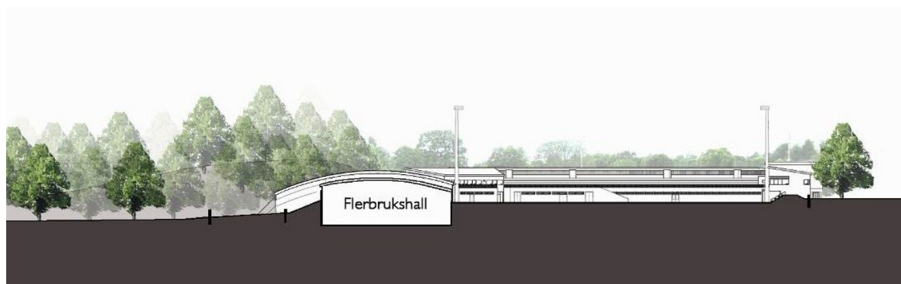
ill.1 (utsnitt illustrasjon fra Spor Arkitekter AS)

Selv om Norges Judoforbund og Go Dai Judo Club i mange år har stått som interessenter (vi meldte vår interesse i 2007), så har vi aldri vært innbudt til samtaler om utforming av anlegget. Det er stort behov for et slikt anlegg. Primære brukere vil være Norges Judoforbund, Norges kampsportforbund, Go Dai Judo Club og Christiania Taekwon-Do klubb, som vil bruke anlegget både til klubbtrening, regionale samlinger, landslagstreninger og nasjonale kurs og treningssamlinger. Men vi kan ikke se at kampsportanlegg er tegnet inn i eksisterende planer, eller at man har intensjoner om å tilrettelegge tilfredsstillende areal for dette. (se f.eks. ill. 1. (Spor Arkitekter AS) og eventuelt sak 200703298, Plan- og Bygningsetatens sider. http://web102881.pbe.oslo.kommune.no/saksinnsyn/casedet.asp?mode=&caseno=200703298 ).